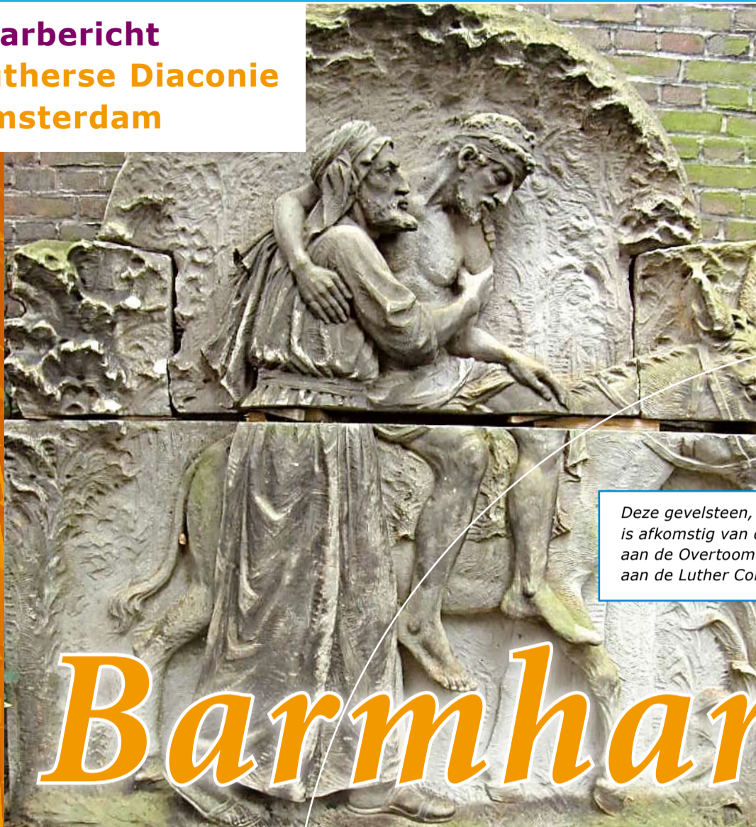
Deze gevelsteen, 'de Barmhartige Samaritaan', is afkomstig van de Diaconessen Inrichting aan de Overtoom in Amsterdam en geschonken aan de Luther Collectie Amsterdam.