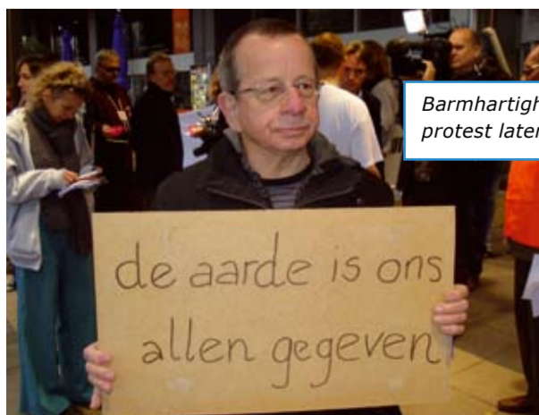
Barmhartigheid is ook protest laten horen.

In het Hebreeuws – de oorspronkelijke taal van het deel van de Bijbel dat we Oude Testament noemen – klinken in het woord Barmhartigheid de woorden ingewanden, baarmoeder en trouw door. Barmhartigheid heeft te maken met bewegen worden tot in je diepste zelf, met trouw aan de ander in al haar vreugde en verdriet.