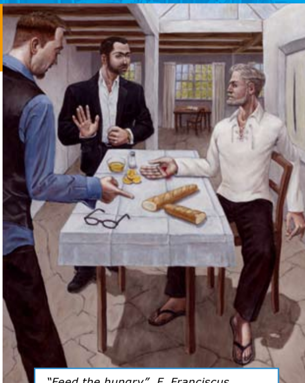
"Feed the hungry", F. Franciscus, courtesy Flatland gallery Utrecht/Paris

Elke dienst stond in het teken van één van de genoemde werken. Ook kunst speelde een grote rol in de diensten. Diverse solisten werkten mee en naast de zeven panelen van de Meester van Alkmaar uit 1504, speelde ook het werk van Frans Franciscus, gemaakt tussen 2007 en 2009, een grote rol. Op een intrigerende manier gaf hij vorm aan de zeven werken van barmhartigheid. Door in elk schilderij prominent een hart te plaatsen laat Franciscus zien dat het in alle zeven werken om liefde gaat. De serie diensten werd afgesloten met een fotoreportage van het werk van Franciscus dat in zeven verschillende Friese kerkjes te zien was geweest. Ook heel wat gemeenteleden hebben deze route bezocht, mede geïnspireerd door de diensten op het Spui.