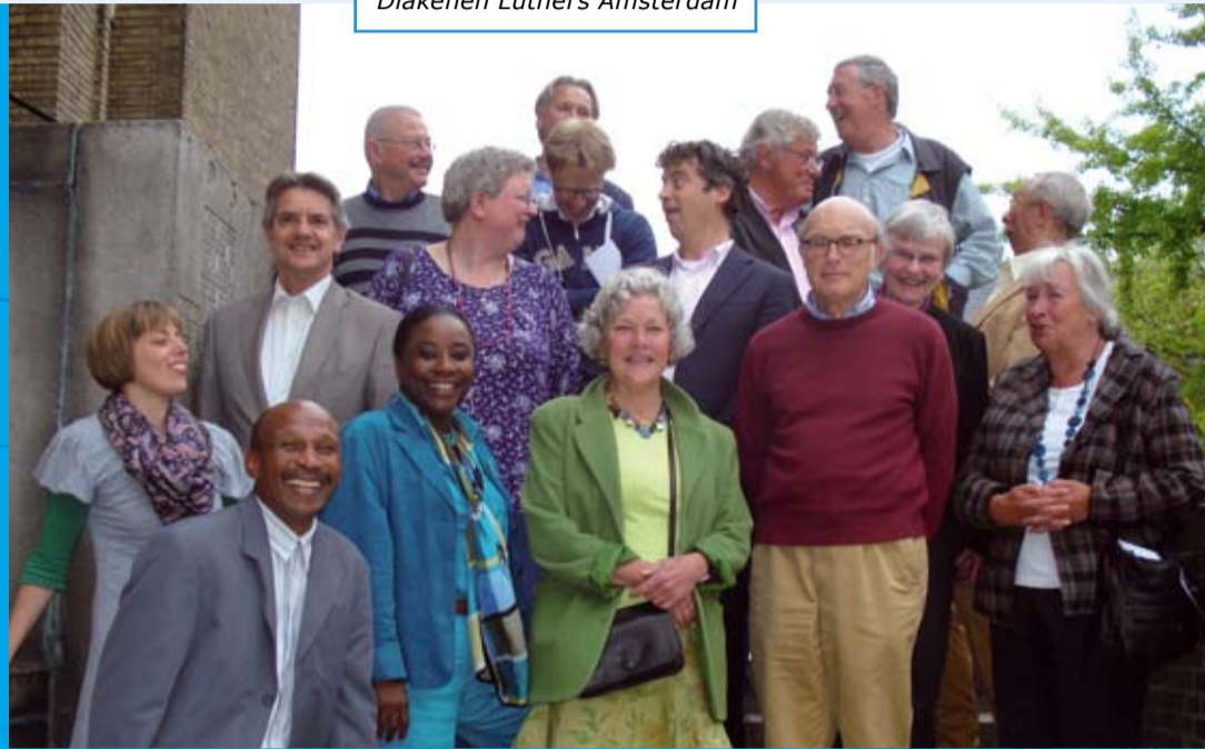
Diakenen Luthers Amsterdam

Er is volop samenwerking met andere kerken en partners, zoals de diaconie van de Protestantse Kerk in Amsterdam. Immers diaconaat doe je samen. Doet u mee? We zoeken vrijwilligers die met tijd, creativiteit en energie willen investeren in recht en barmhartigheid. Zie voor het vacatureoverzicht www.diaconie.com . U kunt de Diaconie ook financieel steunen door een gift over te maken op ING 4620048. Of vraag de folder Notariële akten, erfenissen en legaten bij ons op.